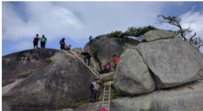
Gambar 1: Aktiviti Pendakian Ke Puncak Gunung Datuk

Hasil temubual pengkaji bersama dengan beberapa masyarakat yang berkunjung diantaranya ialah, renjer hutan, pengawas hutan, pendaki gunung, pelancong luar dan masyarakat sekitar di Hutan Lipur Gunung Datuk. Menurut pihak renjer hutan menyatakan bahawa Gunung Datuk merupakan puncak tertinggi di daerah ini dengan ketinggian melebihi 2,900 kaki dan di gunung ini juga letaknya tapak asal pokok Merbau yang mana nama daerah ini diperolehi. Pendaki gunung yang sampai di kemuncaknya boleh melihat pemandangan yang luas di bahagian barat dari gunung - gunung Sungai Ujong menyeberangi pinggir laut hingga ke Selat Melaka. Gunung ini juga kaya dengan lagenda, antaranya tapak kaki di puncaknya yang menyumbang kepada lagenda pahlawan Melayu, Hang Tuah, yang dikatakan berhenti seketika sebelum meneruskan perjalanan ke Tanjung Tuan.