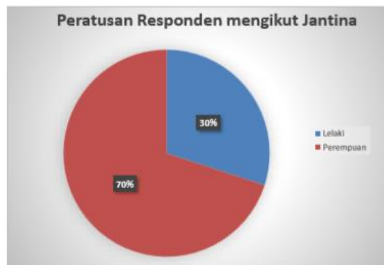
Rajah 1. Peratusan Responden Mengikut Jantina.

Secara umumnya lokasi yang dipilih ialah sekitar tempat daerah Rembau dan Hutan Lipur Gunung Datuk sebagai kawasan kajian untuk kajian soal selidik ini. Sejumlah 100 responden terlibat dalam kajian ini yang terdiri pelbagai lapisan masyarakat dipilih secara rawak. Kaedah pengedaran borang soal selidik kepada para pengunjung yang berkunjung dan melalui pemerhatian seperti gambar-gambar di kawasan persekitaran di kawasan kajian telah diambil melalui kamera serta kaedah temu bual secara spontan kepada para pengunjung, renjer hutan, pengawas hutan dan masyarakat setempat bagi mendapat data-data atau maklumat-maklumat yang di perlukan bagi mengukuhkan hasil kajian.