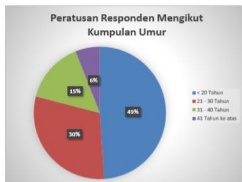
Rajah 2. Peratusan Responden Mengikut Kumpulan Umur.

Hasil daripada soal selidik yang ditunjukkan pada Rajah 1 di atas didapati bahawa peratusan responden perempuan adalah lebih tinggi iaitu sebanyak 70% berbanding responden lelaki iaitu sebanyak 30%. Hal ini terjadi kerana perempuan lebih ramai melibatkan diri dalam aktiviti-aktiviti sekitar Hutan Lipur Gunung Datuk dan sekitar daerah Rembau dalam perniagaan mahupun aktiviti riadah bersama keluarga berbanding kaum lelaki.