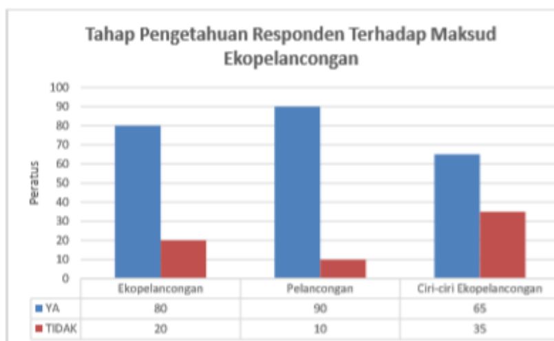
Rajah 3. Tahap Pengetahuan Responden Terhadap Maksud Ekopelancongan.

Hasil daripada soal selidik yang ditunjukkan pada Rajah 2, didapati bahawa peratusan responden yang berumur diantara < 20 tahun lebih tinggi berbanding yang lain-lain iaitu sebanyak 49% berbanding kumpulan umur 21-30 tahun, 31-40 tahun dan 41 tahun ke atas iaitu masing-masing 30%, 15% dan 6%. Hal ini terjadi kerana lingkungan umur < 20 tahun lebih cenderung melibatkan aktiviti-aktiviti di sekitar Hutan Lipur Gunung Datuk kerana masih muda dan cergas dalam aktiviti pendakian gunung, promosi, perniagaan dan sebagainya.